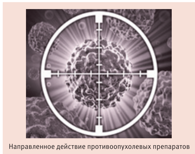
Направленное действие противоопухолевых препаратов

вины больных с опухолевыми заболеваниями получают ХТ.