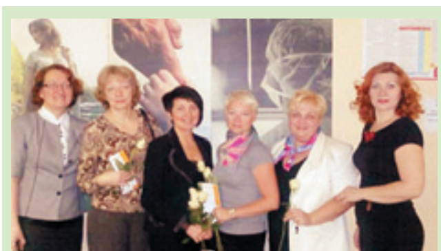
Преподаватели Школы онкологического пациента

Ключевые слова: рак молочной железы, Школа онкологического пациента, медсестра и онкологический больной, медсестринская помощь.