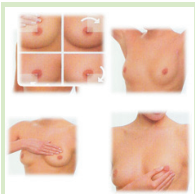
Основные этапы самообследования молочных желез

области, медсестры онкологического диспансера приняли активное участие в проведении для педагогов и медработников мастер-классов по обучению элементам самообследования МЖ и профилактике заболеваний РМЖ. На занятиях мы сообщали слушательницам курсов, какие виды диагностического обследования существуют. Это – консультация у маммолога и инструментальное обследование – маммография, ультразвуковое исследование молочных желез, биопсия (пункция молочной железы). Можно также провести анализ на онкомаркер. Демонстрировали элементы и правила самообследования МЖ. Важнейшая цель самообследования – не поиск опухоли, а подтверждение ее отсутствия.