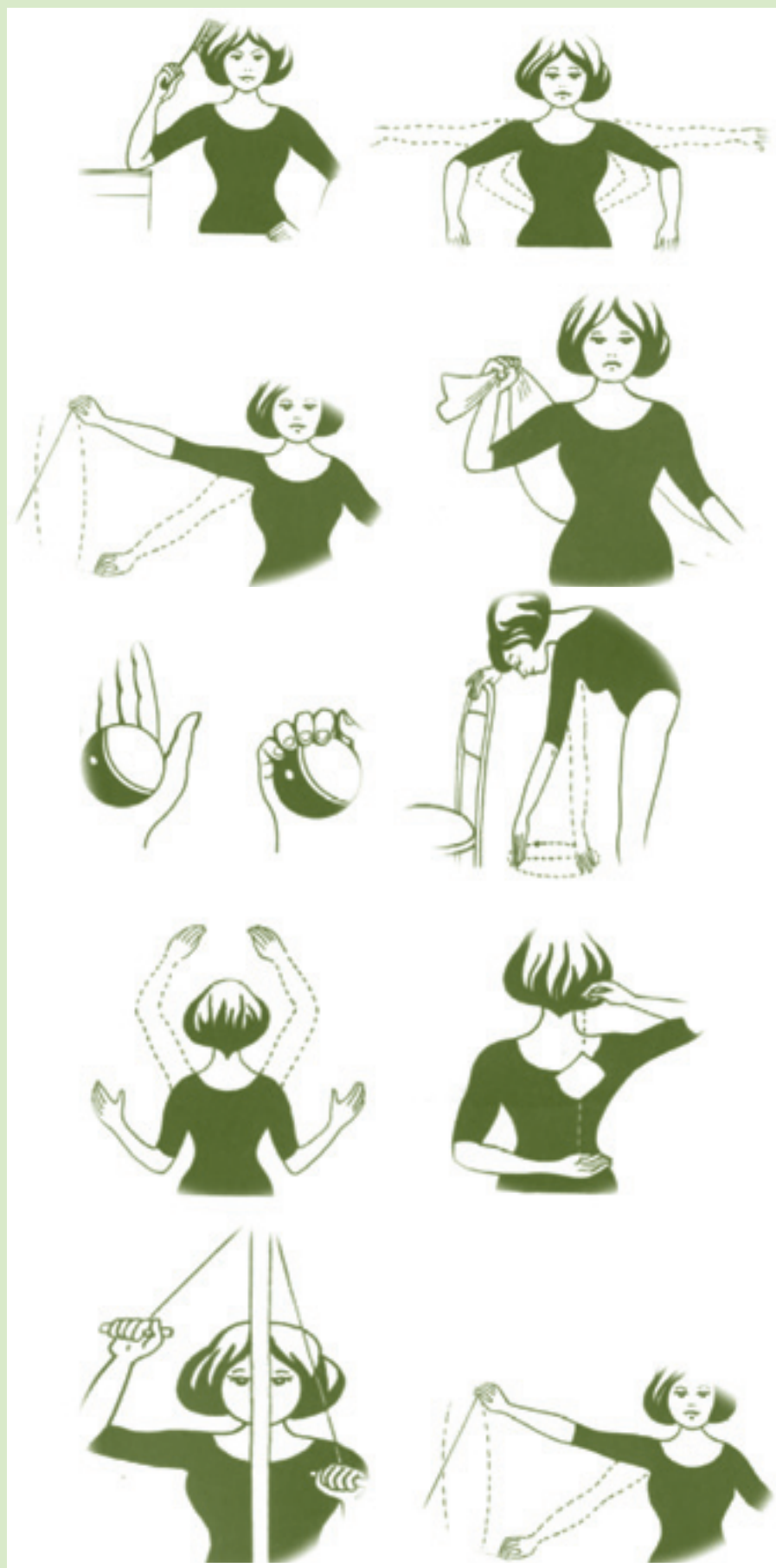
Основные упражнения лечебной гимнастики для женщин, перенесших мастэктомию

Тревожные статистические данные о росте частоты злокачественных новообразований у женщин области побудили медсестер Архангельского клинического онкологического диспансера участвовать в профилактических мероприятиях по борьбе с онкологическими заболеваниями в Архангельске и Северодвинске. В рамках месячника, организованного Ассоциацией медицинских работников Архангельской